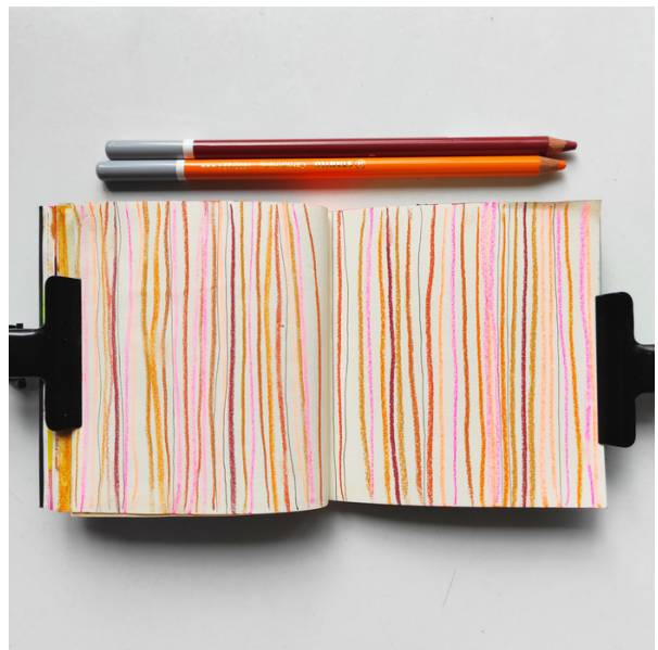
Les petites pages du mois d'avril sur le thème Ethnique.