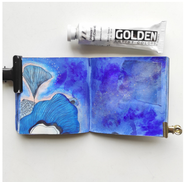
Les petites pages du mois de janvier sur le thème Bleu.