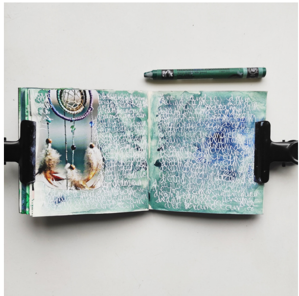
Les petites pages du mois de février sur le thème Forêt Verte.